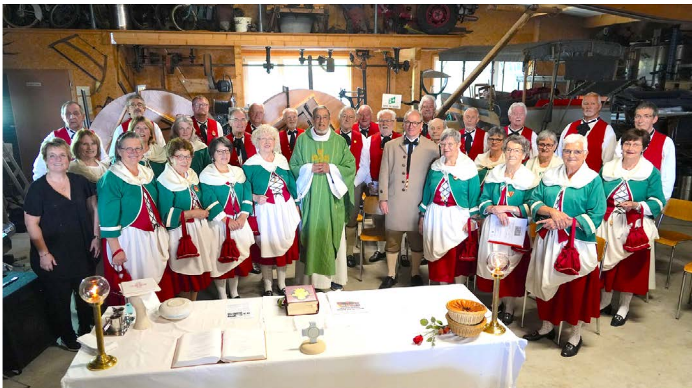
Une messe en patois: c'était le 7 juillet 2024 à Grandfontaine JU

Voici les temps forts de l'offre de RTSreligion durant l'Avent et les Fêtes de fin d'année: