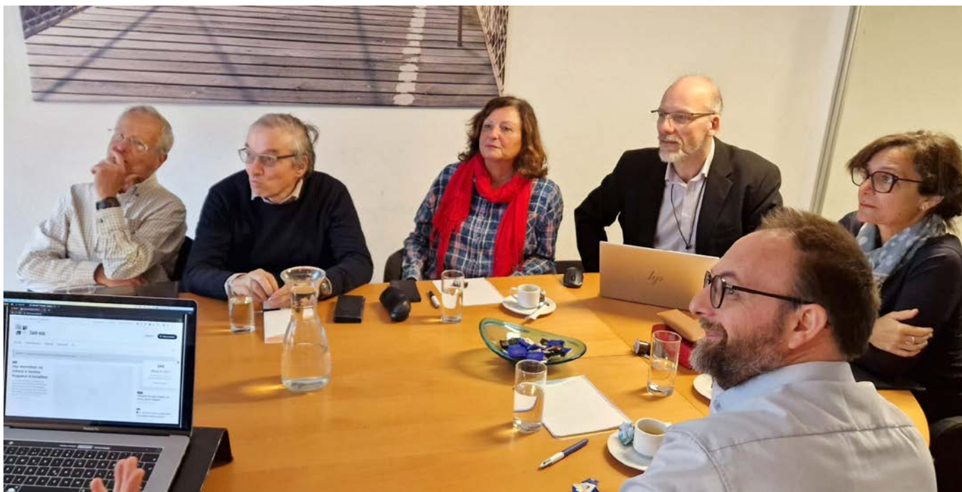
Cath-Info en séance à l'agence WNG.

cath.ch prépare activement la mue de son site internet et de ses infrastructures techniques. Des chantiers qui mobiliseront l'équipe pendant plusieurs mois.