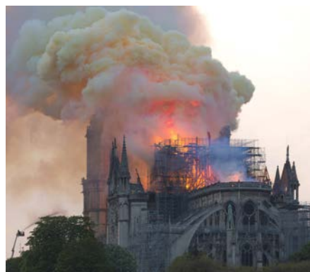
Notre-Dame en feu

«La foi et le pouvoir», RTS Espace 2, dimanche 8 décembre à 11h